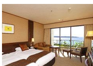
オーシャンウイング スタндартツインルーム