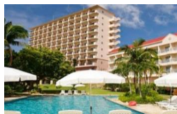
*空港送迎サービスあり(事前予約制) *大会会場まで約5km。大会当日は 選手送迎バスを大会主催者が運行。

ドイツ文化村に隣接し美しい海の目の前に建つ自然溢れるリゾートホテル。 中庭には一年中美しい花々が咲き誇り、南国リゾートステイを満喫いただけます。 タワー館は全室オーシャンビュー。リゾート気分でお寛ぎいただけます。