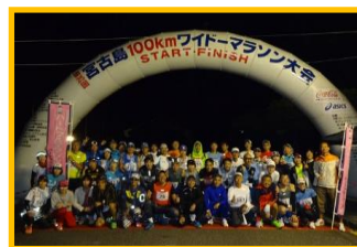
宮古島100kmワイドー Marathonツアー記念撮影 (100km参加の選手みなさんとスタート前に)