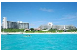
*空港送迎サービスあり(事前予約制) *大会会場まで約2km。大会当日は 選手送迎バスを大会主催者が運行。

ホテルの目の前に広がる「与那覇前浜ビーチ」は日本のベストビーチに選ばれる 程の美しさで、疲れたからだを癒してくれるでしょう。レストラン、ショップ、 スパなどの施設も充実しリゾートステイをお楽しみいただけます。